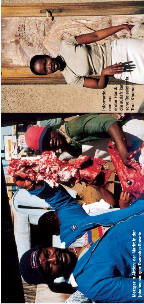
Metzer in Aktion: der Markt in der Johannesburger Township Soweto