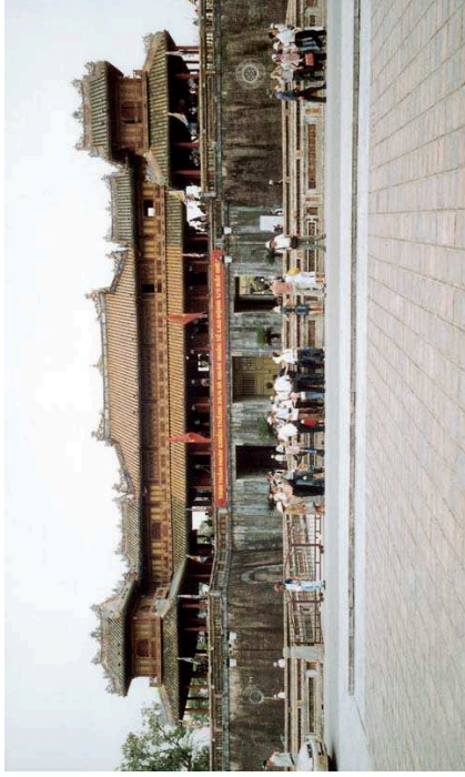
Eingang zum Kaiserpalast in Huế

mand die Schrecken der Pol-Pot-Zeit vergessen, als die Menschen, wollten sie überleben, alles essen mussten, was sich auf vier oder mehr Beinen bewegte. Die Hauptadern des Landes sind mittlerweile von Minen frei, den Opfern aber gibt niemand ihre Beine, Arme oder Augen zurück. So wunderschön das Land ist, so tief beklemmend und bedrückend sind die Relikte des Pol-Pot-Regimes, das große Teile der Bevölkerung auf dem Gewissen hat. Die Gedankstätten sprechen für sich und lassen hoffen, dass die Menschen Wege finden, dass solche Ausbrüche der tiefsten Barbarei und Menschenverachtung für alle Zeiten verschwinden. Noch spricht in Kambodscha Hauptstadt Phnom Penh und in den Provinzstädchen der Verkehr nicht wie in Vietnams Metropolen. Hier schwört man noch auf die japanische Marke Honda. Die chinesischen Motorroller, so sagt unser Guide, die taugen nichts. So gehen die meisten zu Fuß oder fahren mit alten Bussen, wenngleich so eine kleine Honda in einem Land wie Kambodscha auch für einen Familienausflug gut ist.